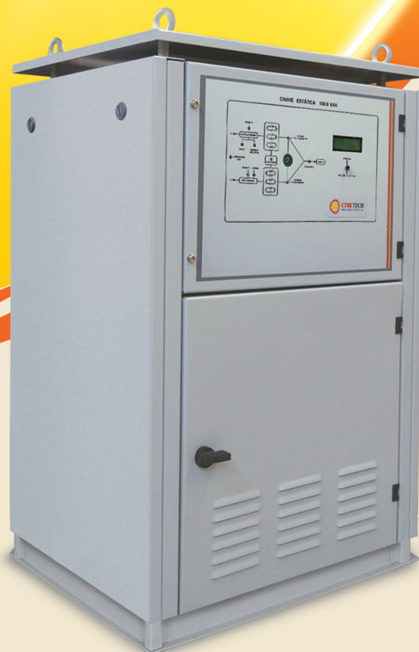
Montagem em gabinete auto-sustentado

As Chaves Estáticas de Transferência CSE, da CTRLTECH são destinadas a alimentação de cargas críticas. Seu controle microprocessado avalia entre duas fontes de alimentação, qual deve alimentar a carga, seguindo em princípio uma prioridade pré-definida, ou seja, em caso de falha da fonte definida como Principal, o controle transfere a alimentação da carga para a outra fonte, chamada de Alternativa, automaticamente e sem interrupção.