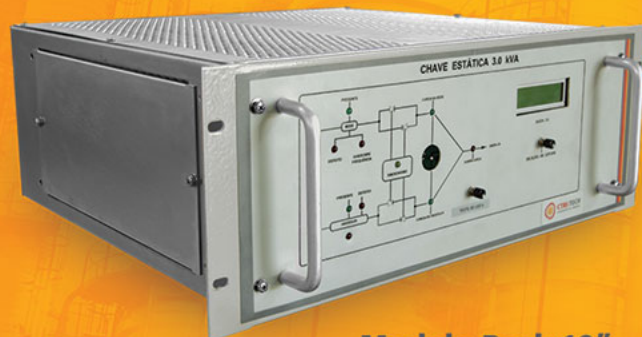
Modelo Rack 19"

Modelo fundo de painel com módulo bypass independente, Hot plug-in