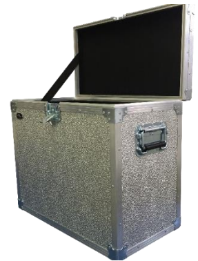
Caixa para Transporte